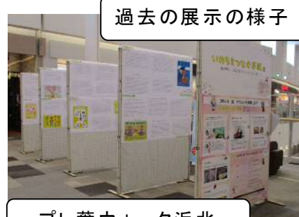
プレ葉ウォーク浜北